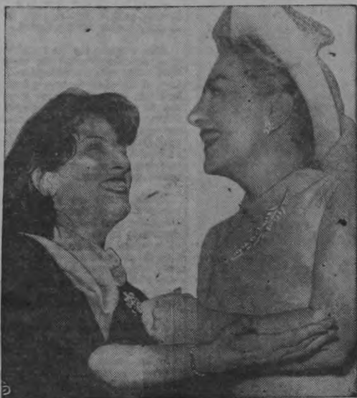
La actriz italiana Anna Magnani y la estrella de cine norteamericana Joan Crawford se abrazan sonrientes al separarse en Nápoles después de haber sido compañeras de viaje hasta Europa. Miss Magnani dijo que regresaba a su país para descansar, Miss Crawford acompañó a su esposo