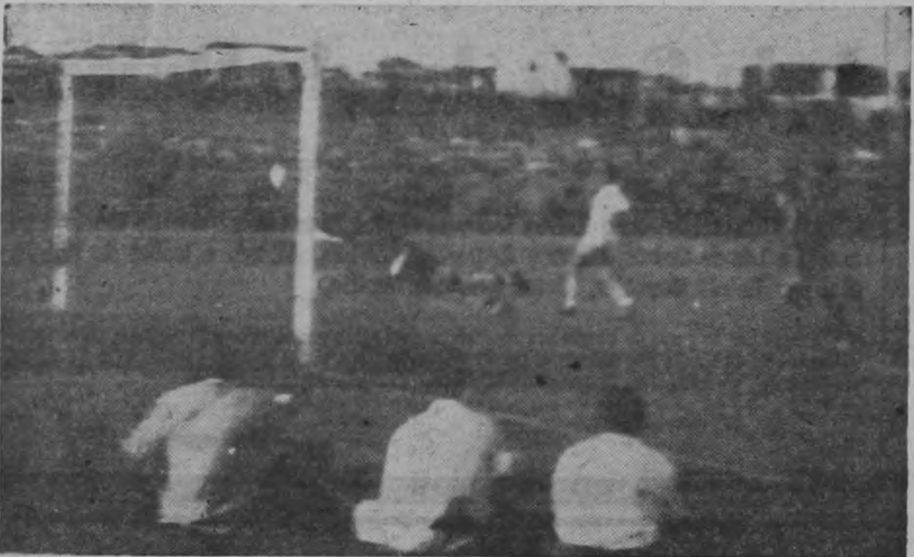
2.— El arquero curazoleño se tira desesperadamente tratando de alcanzar el esférico.