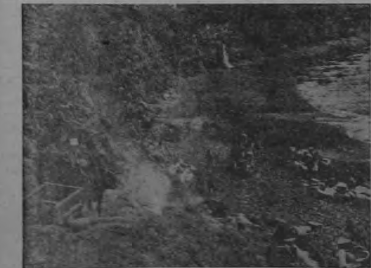
Las playas de la isla Tristán son casi un sitio desolado. Muy lejos de las rutas que siguen los vapores, se hallan las islas de Tristán da Cunha.