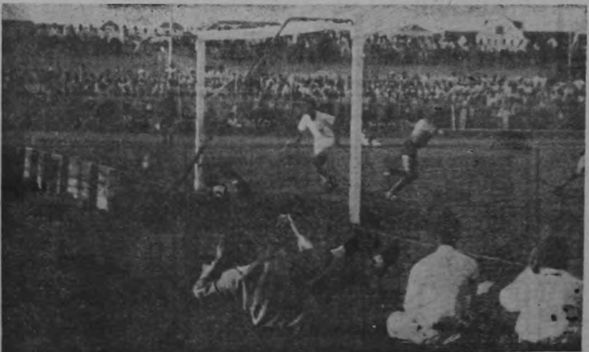
4.— El balón entra en la valla de Curazao y se concreta el segundo gol de Costa Rica.