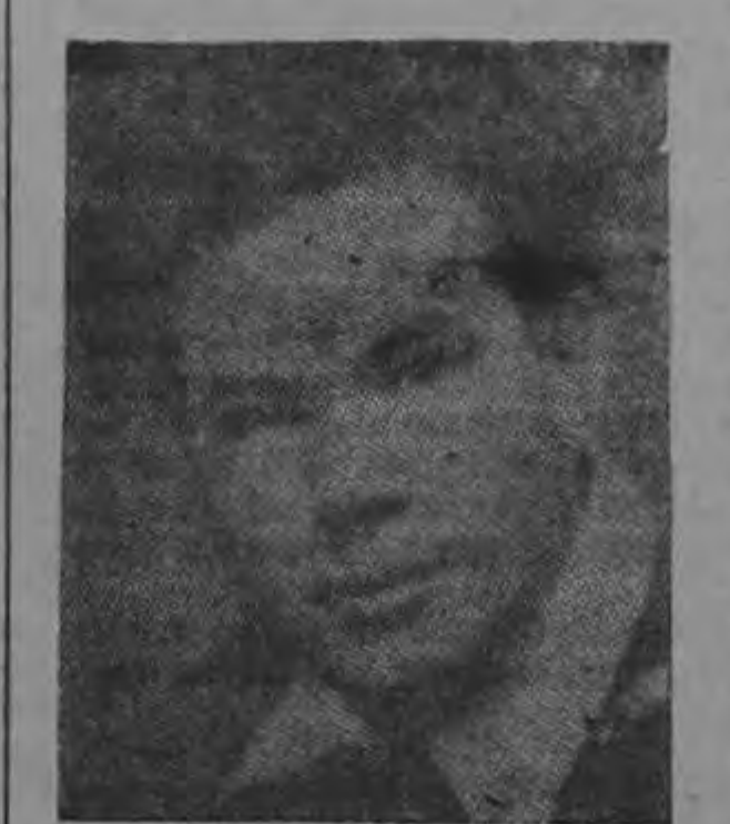
GUSTAVO SILESKY el titán del canto...