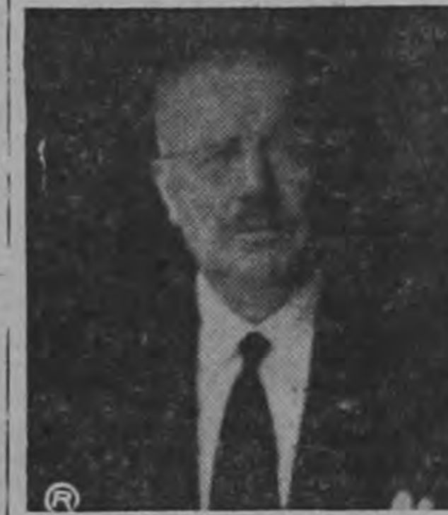
IBANEZ DEL CAMPO

WASHINGTON 9 (INS) La Casa Blanca anunció hoy que el Presidente de Chile, Carlos Ibáñez del Campo, hará una visita oficial de diez días a los Estados Unidos durante el próximo mes de diciembre invitado por el Presidente Eisenhower.